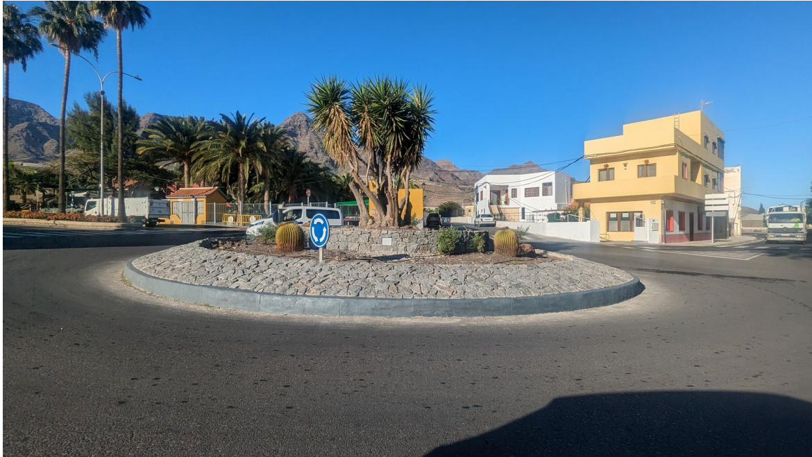
Rotonda casco finalizada

Se retirará por parte del servicio de mantenimiento del ayuntamiento todos los arbustos exteriores de la rotonda.